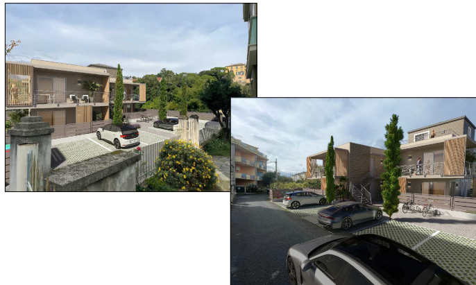
TAVOLA 6 FOTOINSERIMENTO

PROGETTO DI RISTRUTTURAZIONE EDILIZIA AI SENSI DELL'ART. 3 COMMA 1 LETT. d DEL DPR 380/2001 CON DEMOLIZIONE DEGLI IMMOBILI SITI IN VIA DANTE N.65, NCEU Fg. 18 MAPPALE 135 ED IN LOCALITA' SANTA LIBERA, NCEU Fg. 9 MAPPALE 15 E SUCCESSIVA RICOSTRUZIONE CON INCREMENTO VOLUMETRICO, AI SENSI DELLA L.R. 49/2009 E ss.mm.ii., DI IMMOBILE AD USO RESIDENZIALE SUL TERRENO SITO IN VIA DEI FEI CENSITO AL NCT Fg. 17 MAPPALE 705 PER CONTO DELL' IMPRESA BERTONE NATALE E C. S.R.L.